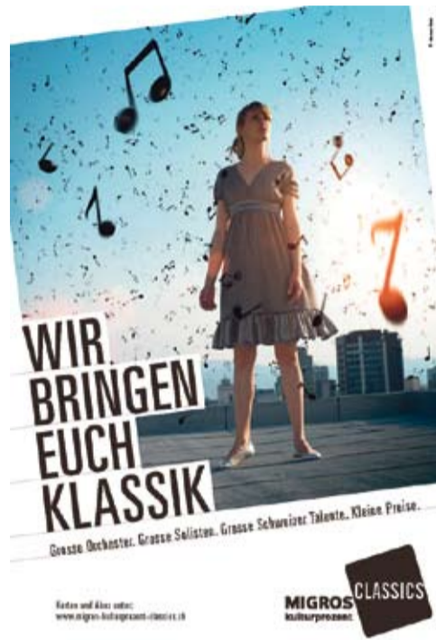
Musiknoten als Naturschauspiel inszeniert.